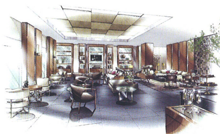
住宿客人专用休息厅 (效果图)