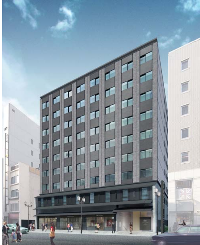
「ロイヤルパークホテル ザ 京都」完成予想図