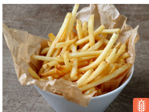
French Fries フレンチフライ 600yen