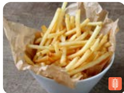
FRENCH FRIES フレンチフライ 500yen