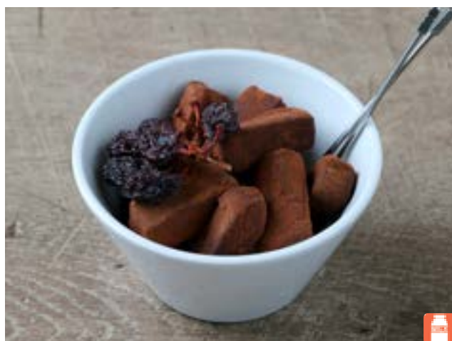
Ganache 800yen 生チョコ