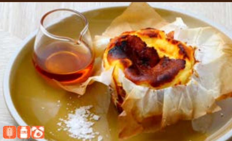
Basque Cheese Cake 800yen