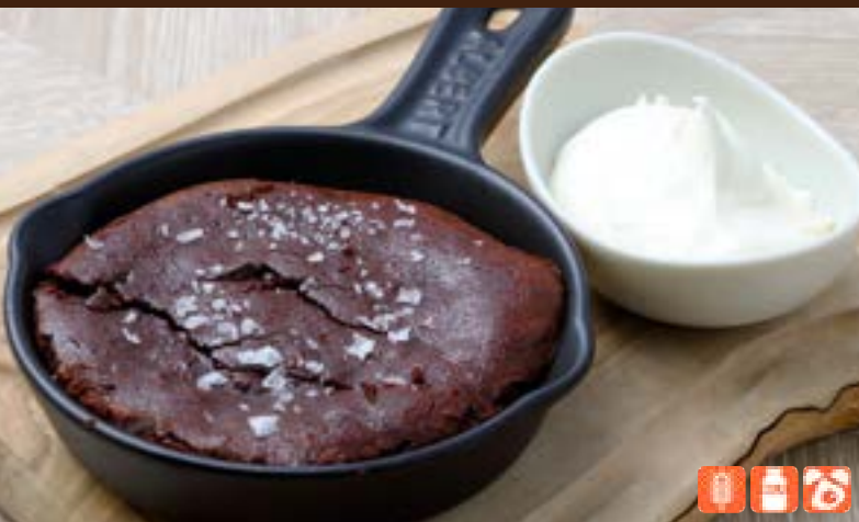
Baked Chocolate 800yen