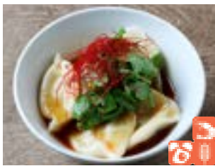
Pakuchi dumpling パクチー水餃子