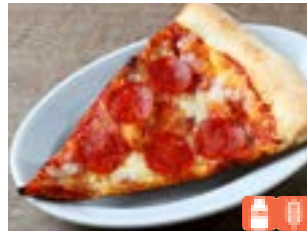
SLICE PIZZA ・PEPPERONI ペパロニ ・MARGHERITA マルゲリータ