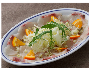
Carpaccio of kanpachi with orange dressing カンパチのカルパッチョ オレンジドレッシング 2,200yen HALF 1,300yen