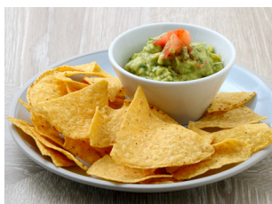
Guacamole ワッカモーレ 1,200yen