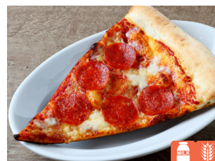
SLICE PIZZA Pepperoni スライスピザ ペパロニ 800yen