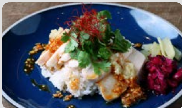
HAINANESE CHICKEN RICE 塩麴カオマンガイ