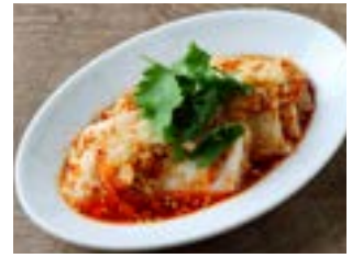
Saliva Chicken よだれ鶏