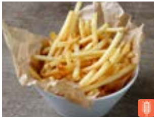
French Fries フレンチフライ