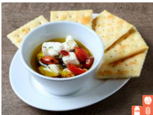
Cheese and nuts in oil 600yen チーズとナッツのオイル漬け