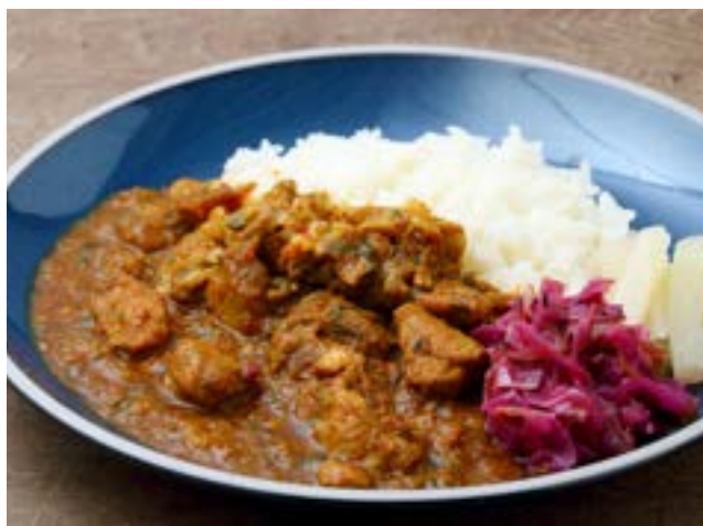
SPICE CHICKEN CURRY AND ACHAR スパイスチキンカレーとアチャール 1,200yen