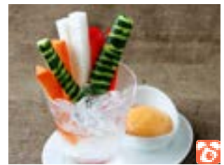
Vegetable Sticks with Yuzu Pepper Dip 野菜スティック 柚子胡椒ディップ