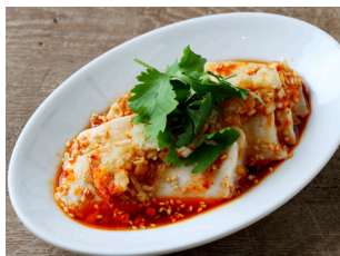
Saliva Chicken よだれ鶏 600yen