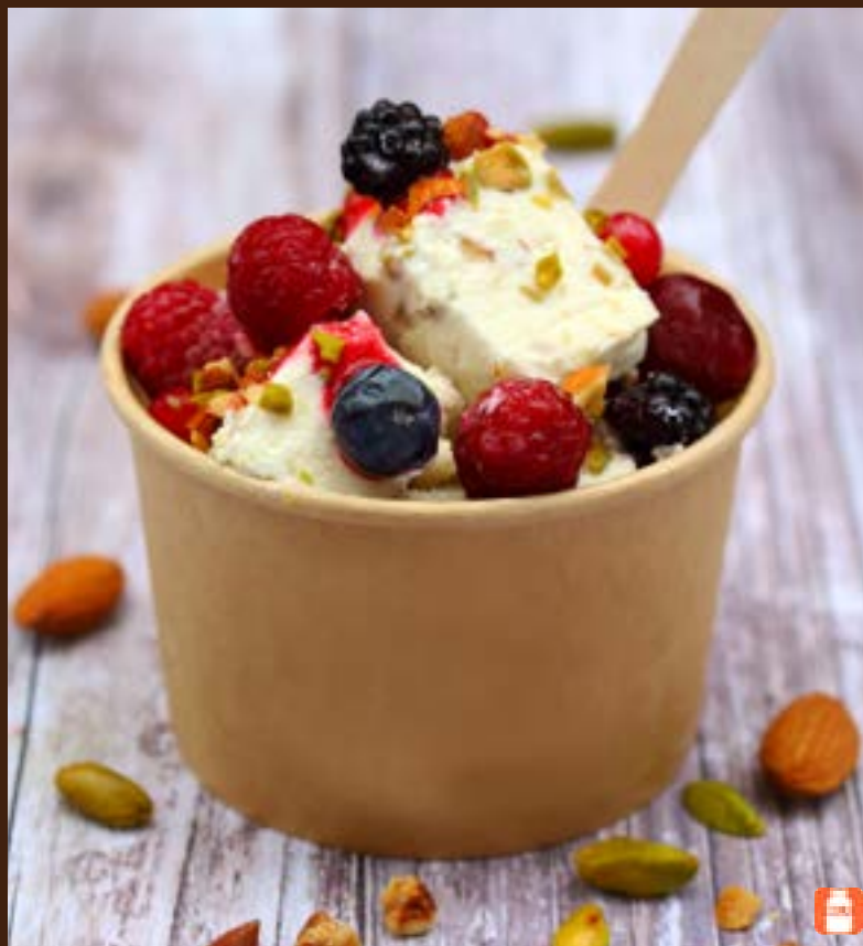
Cassata with nuts and Berries 800yen