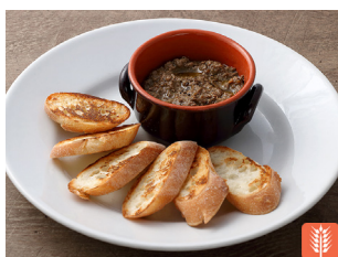
Chicken liver and porcini crostini 鶏レバーとポルチーニの クロスティーニ 1,600yen HALF 900yen

1F Il Cardinale Ginza Corridor Store's popular menu