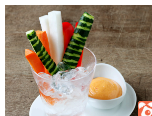
Vegetable Sticks with Yuzu Pepper Dip 野菜スティック 柚子胡椒ディップ 600yen