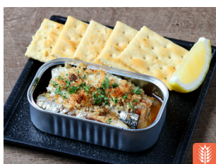
Oven-baked smoked oil sardine スモークオイルサーディンの オープン焼き 1,100yen