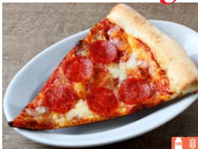
SLICE PIZZA Pepperoni 800yen スライスピザ ペパロニ