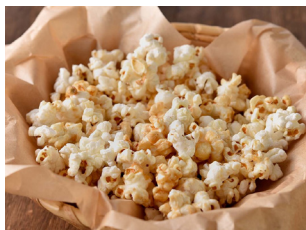
Popcorn ポップコーン 800yen