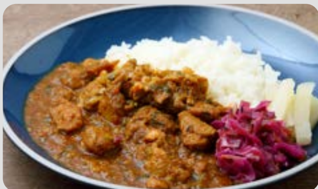
SPICE CHICKEN CURRY AND ACHAR スパイスチキンカレーとアチャール

白菜とキノコの優しい旨味たっぷりのクラムチャウダー。 発酵バターのクロワッサンと一緒にどうぞ。