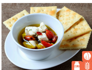
Cheese and nuts in oil チーズとナッツのオイル漬け 600yen