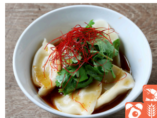
Pakuchi dumpling パクチー水餃子 700yen