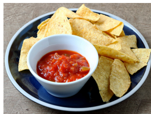
Nachos with Salsa Sauce ナチョス サルサソース 700yen