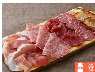
Prosciutto and Salami Platter 生ハムとサラミ盛り合わせ 2,800yen HALF 1,600yen