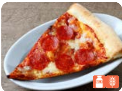
SLICE PIZZA Pepperoni スライスピザ ペパロニ 800yen