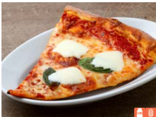
SLICE Margherita 800yen スライスピザ マルゲリータ