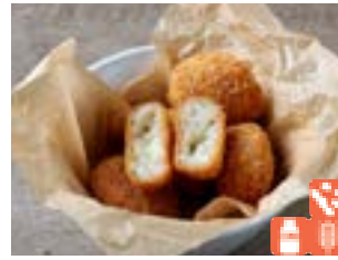
Rice Croquette with Truffle トリュフのライスコロッケ