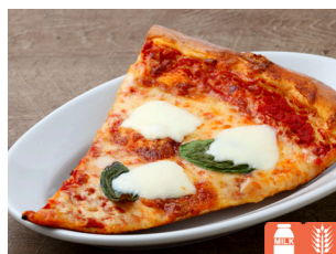
SLICE PIZZA Margherita スライスピザ マルゲリータ 800yen