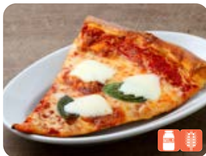
SLICE Margherita スライスピザ マルゲリータ 800yen