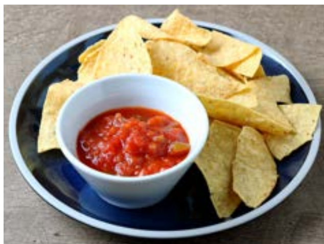
Nachos with Salsa Sauce 700yen ナチョス サルサソース