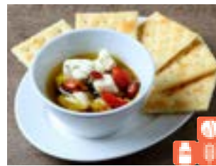
Cheese and nuts in oil チーズとナッツのオイル漬け