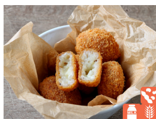
Rice Croquette with Truffle トリュフのライスコロケ 800yen