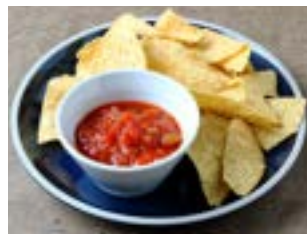
Nachos with Salsa Sauce ナチョス サルサソース