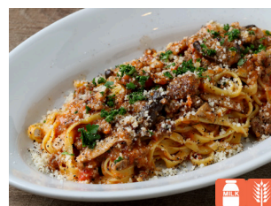
Tagliatelle with salsiccia and mushrooms サルシッチャとキノコの タリアッテレ 1,700yen

※表示価格は消費税込です。サービス料・席料はいただきません。 ※レストラン&バーのご利用料金のお部屋付けはお断りしております。