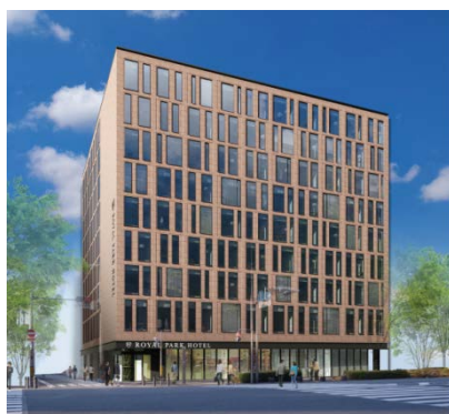
(仮称) ザ ロイヤルパークホテル 京都3号店