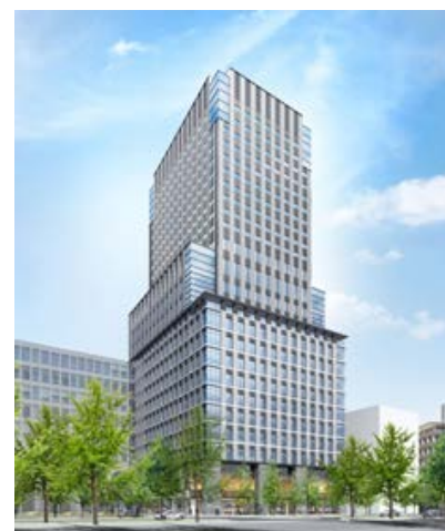
ザ ロイヤルパークホテル 大阪御堂筋