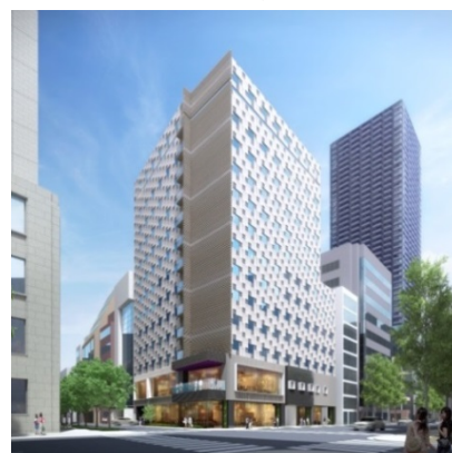
ザ ロイヤルパーク キャンパス 大阪北浜