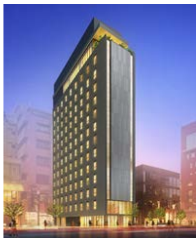
(仮称) ザ ロイヤルパーク キャンパス 東京銀座