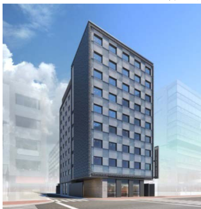
ザ ロイヤルパークホテル 京都四条