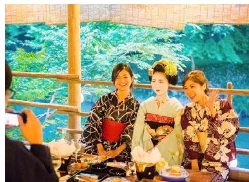
舞妓さんがお席にお邪魔した際に、ご自身のカメラでの写真撮影をお楽しみいただけます。