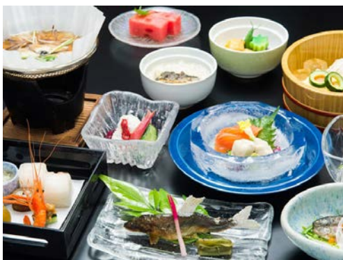
ご夕食のお料理は3種類のコースからお好きなものをお選びいただけます。