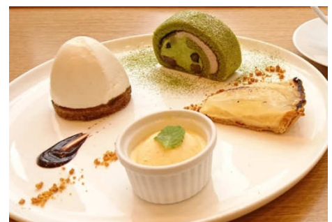
ムッシュいとう特製デザート