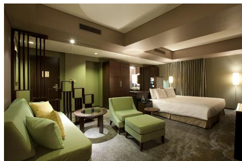
ジュニアスイート(キング)