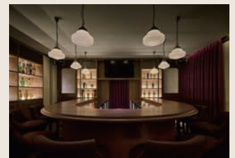
2F バー「木挽町クラブ」 Bar "KOBIKICHŌ-CLUB" 19席/seats