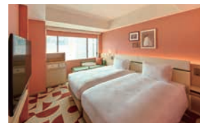
スーペリア ツイン Superior Twin