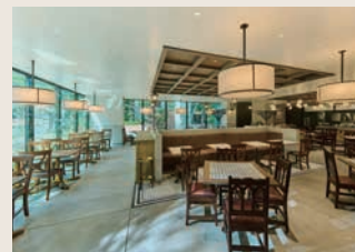
1F レストラン「洋食屋銀座ランプ亭」 Restaurant "YOSHOKU-YA GINZA LAMP-TEI" 84席/seats