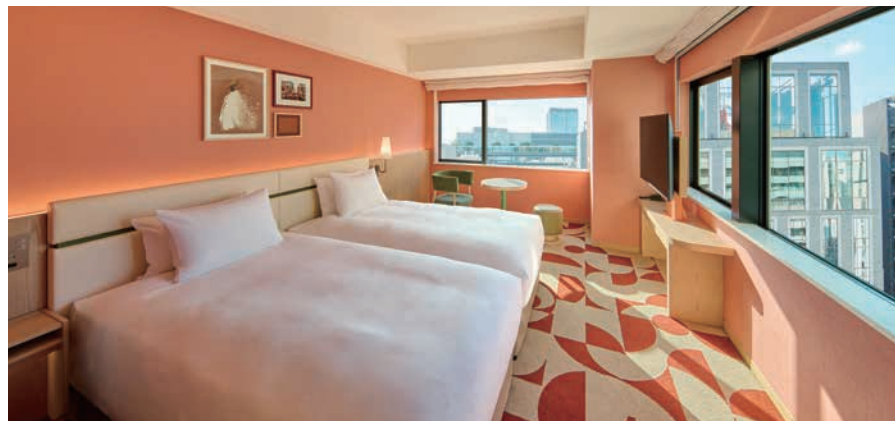
コーナーデラックス ツイン Corner Deluxe Twin

Drawing inspiration from the persimmon red-orange and muted green colors used in the stage curtains of Ginza's Kabukiza Theatre, the guest rooms have modern designs with high functionality that incorporate bold and vivid designs found in the cute trend popular during the Taisho and early Showa eras.