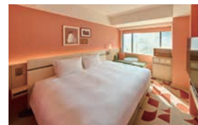
スーペリア キング Superior King