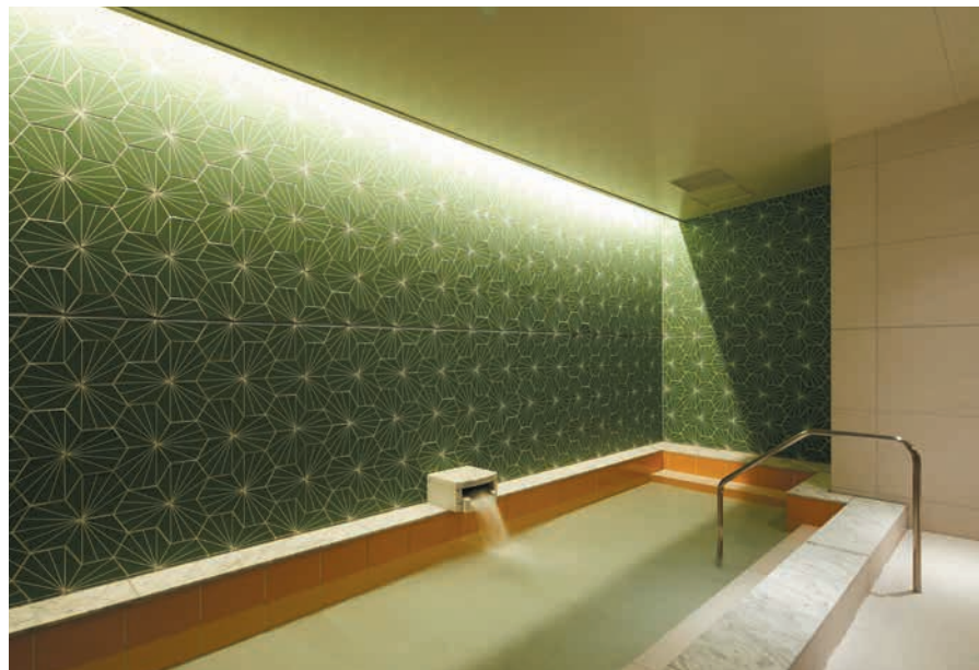
大浴場 Public Bath