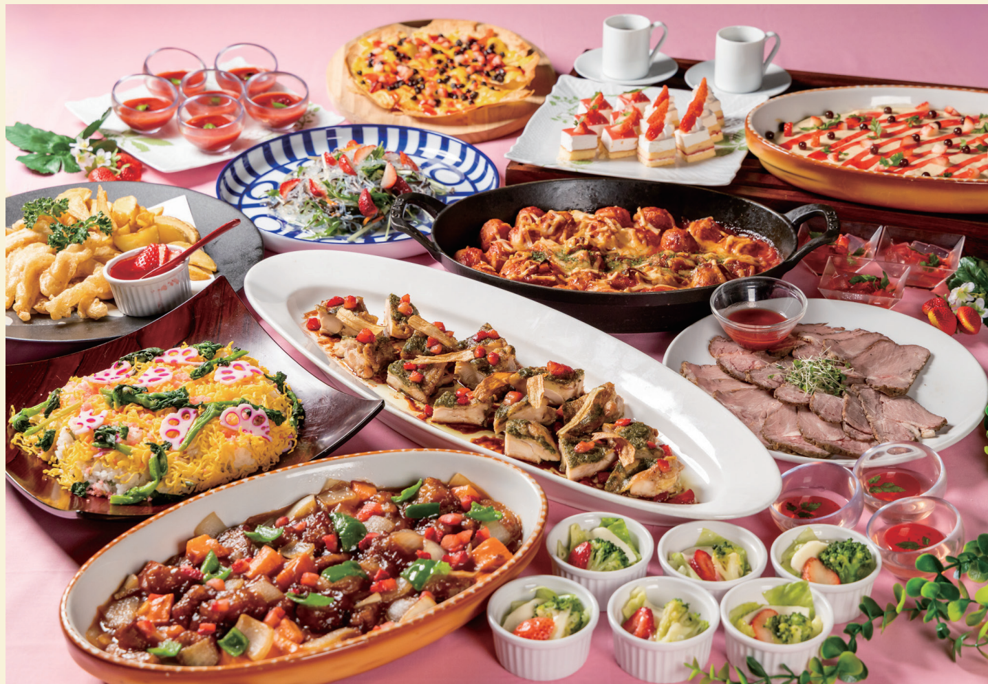
※ 画像は全てイメージです。