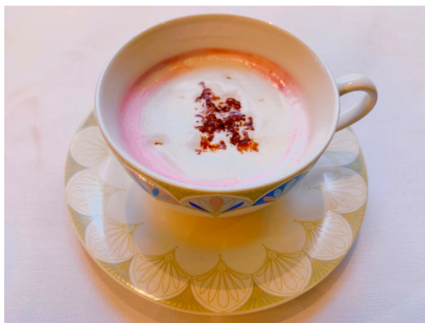
甘すぎずフルーツを思わせる酸味で後味すっきり「ホットチョコレート」

料 金 : ルビーチョコサンド 715円(コーヒー又は紅茶セット 追加302円)