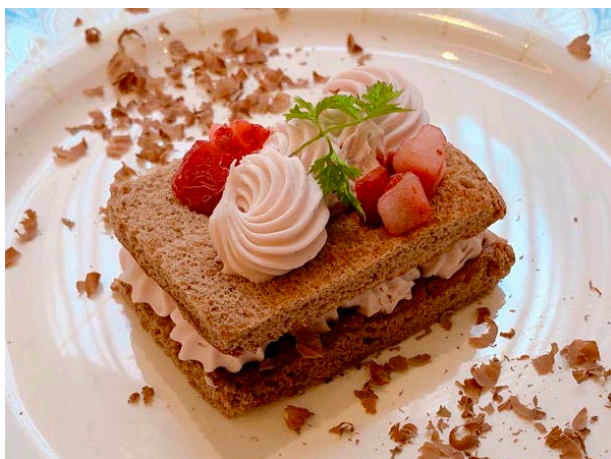
ルビーチョコレート本来の味を活かした生クリームをチョコレートスポンジで挟んだ「ルビーチョコサンド」

ルビーチョコレートが持つフルーティーな味わいと、ほんのりピンク色をした可愛らしい見た目をお楽しみください。