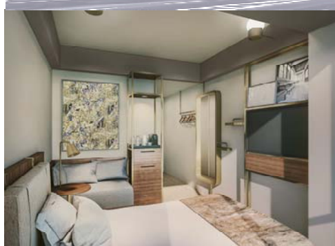
(上) 外観イメージ (下) 客室イメージ