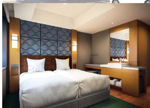
(上) 外観イメージ (下) 客室イメージ

ザ ロイヤルパーク キャンパス 京都二条 は、2021 年春開業を予定しています。ホテル目の前となる JR・市営地下鉄二条駅付近には、2 つの大学のキャンパスがあり、近隣にはミレニアル世代の嗜好に合致した施設などができつつあるエリアとなっております。